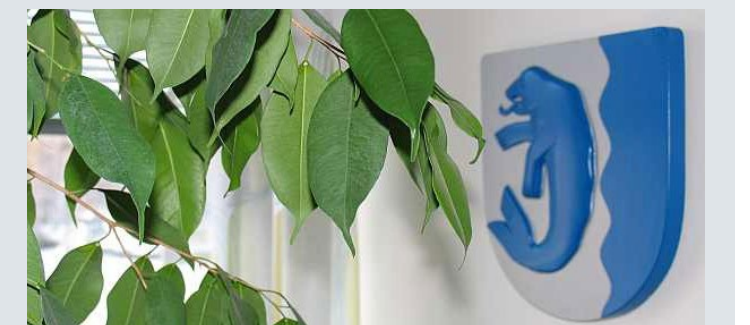
Iin kunnanvaltuustoon valitaan 31 valtuutettua.

tuksen ja opetuksen palvelut. Vierivä kivi ei sammaloidu. Aktivoimme ikäihmisiä liikunta-, kulttuuri- ja järjestötoimintaan. Yhdessä Pohteen kanssa kehitämme palveluja. Emme anna periksi Pohteen jäärpäisyydelle, vaan tuomme esille näkemymme palvelutarpeesta.